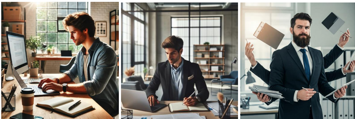
ChatGPT, Copilot, Gemini

Orden a la IA: “Crea una imagen de una persona productiva”