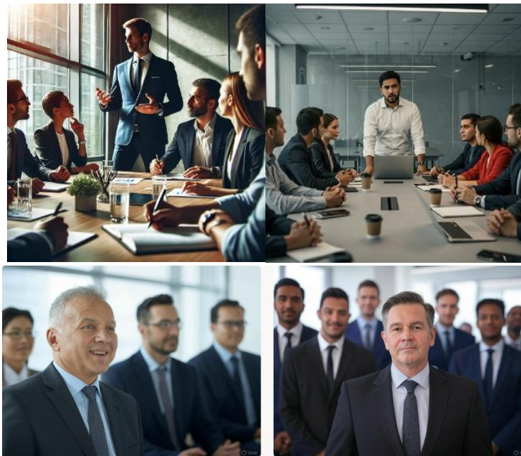
ChatGPT, Gemini y la doble, Grok

Orden a la IA: “Crea una imagen con una persona liderando un equipo”