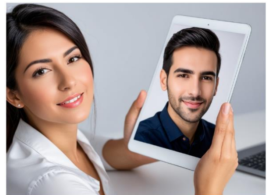
Deep Dream Generator

Para finalizar con este ensayo, hemos realizado la misma pregunta a las seis AI generativas del principio: ¿No crees que el uso que haces siempre del género masculino para referirse a profesiones de alta cualificación donde hay muchas más mujeres que hombres contribuye a la invisibilización del género femenino? Estos son los resultados