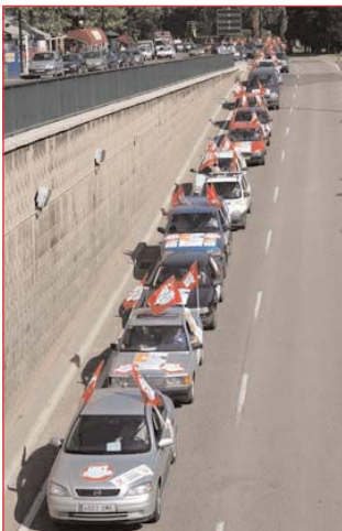
Caravana de coches en Aragón

Aznar debería recordar que la prepotencia es directamente proporcional al nivel de mediocridad