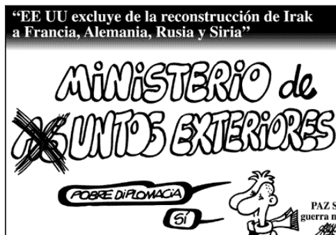
Forges. Publicado en el diario "El País" el sábado 5 de abril de 2003

"Sólo tenemos la fuerza de la razón y la de las armas del movimiento sindical para defender la paz y la libertad, el orden internacional, la democracia y la vida", y por ese motivo participaremos en todas las acciones contra la guerra que se convoquen y contribuiremos de forma individual en las movilizaciones y en la huelga general de dos horas del 10 de Abril. Esta es la decisión de diez mil sindicalistas de Comisiones Obreras, entre los que se encuentran los ex secretarios generales Marcelino Camacho y Antonio Gutiérrez, miembros de Comités de Empresa, secretarios generales de grandes y pequeñas Secciones Sindicales, sindicalistas de base..., que han firmado un manifiesto donde explican su decisión de participar en el paro de dos horas del próximo 10 de Abril convocado por UGT.