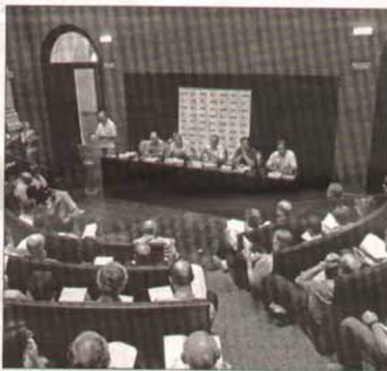
Una de las salas del Paraninfo se llenó ayer a favor del manifiesto. A.PRESI