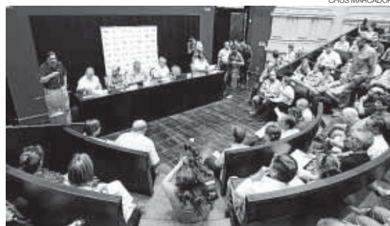
► Lectura del manifiesto contra la reforma, ayer en el Paraninfo.

Ambos dirigentes consideraron que la huelga general es «muy justa y absolutamente necesaria», porque servirá para mostrar el rechazo de la ciudadanía a la política económica del Gobierno de Zapatero, que de no cambiar retrasará la recuperación e incrementará el paro, según aseguraron. «Esperar que una reforma la-