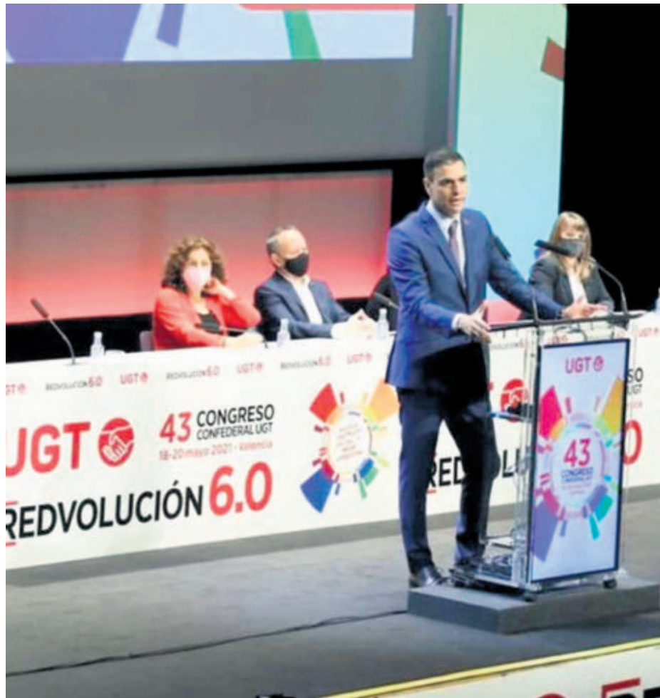
EL PRESIDENTE DEL GOBIERNO, PEDRO SÁNCHEZ, EN EL CONGRESO CONFEDERAL DE LA UGT, NO PRIORIZÓ

Por último, precisó que se destinarán 3.000 millones de euros hasta el ejercicio 2027 a la denominada "garantía juvenil plus", que supondrá "un plan de