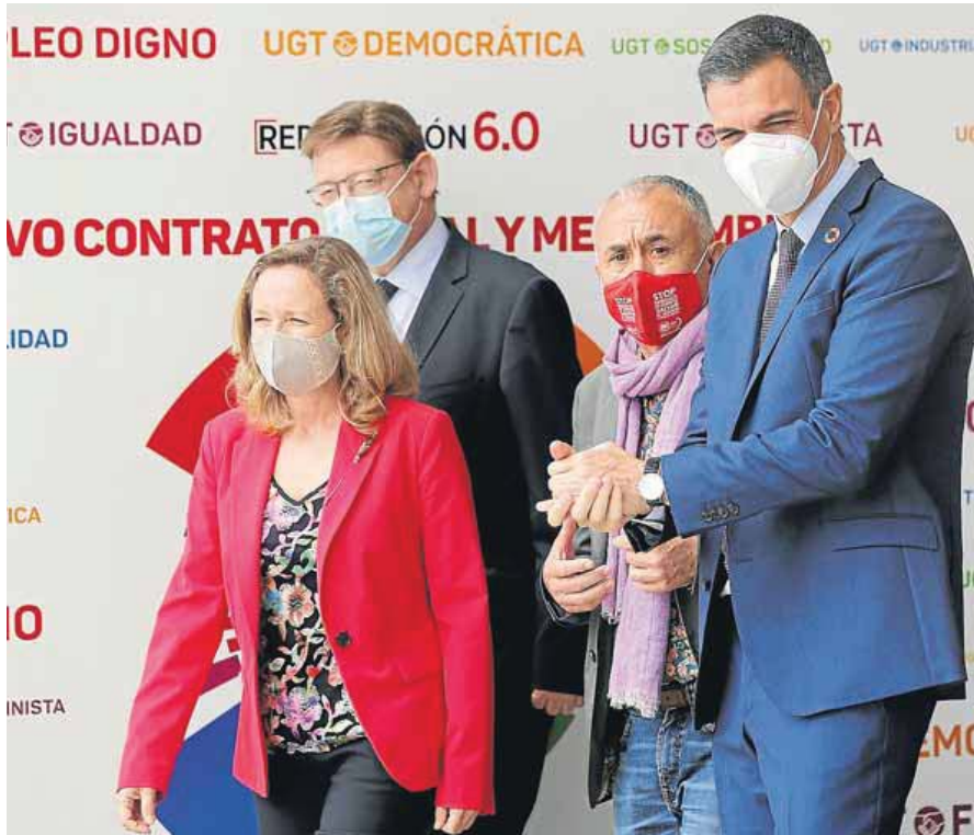
Pedro Sánchez, Nadia Calviño, Pepe Álvarez y Ximo Puig, ayer, en el Congreso de UGT en Valencia.

chazó los ERE anunciados por grandes empresas porque «generan alarma social, incompreensión y trasladan a la opinión pública que la transformación tecnológica es algo de una minoría y no de la mayoría, cuando es el principal reto y desafío». «No podemos consentir que sectores que pagan millones en sueldos a sus ejecutivos, que no han dejado de crecer y crecer y crecer durante la pandemia, anun-