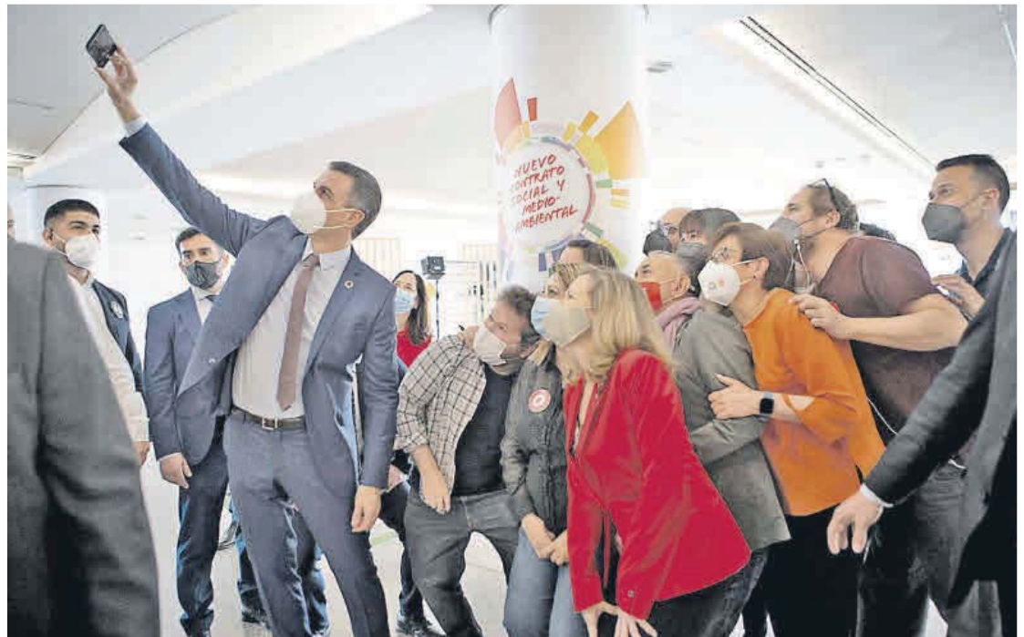
Pedro Sánchez hace una fotografía con la ministra Calviño y el líder de UGT, Pepe Álvarez, entre otros, durante su visita de ayer a València.

ces, avanzó un plan de 1.365 millones de euros para fomentar el empleo juvenil que aspira a generar un millón de contratos en tres años. Destinará 600 millones para que las autonomías financien contratos a menores de 30 años y 765 millones para mejorar la inserción laboral en áreas emergentes.