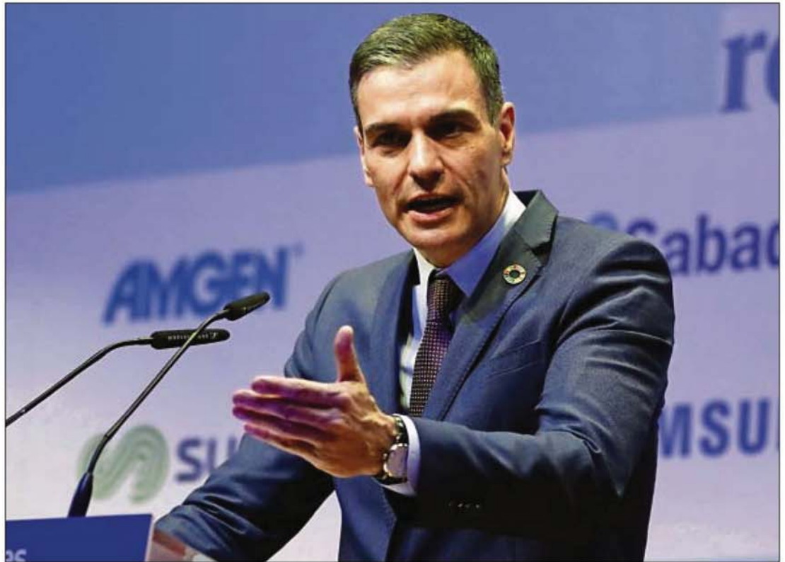
El presidente del Gobierno, Pedro Sánchez.

Y, en tercer lugar, el 'Proyecto Tándem', un plan que contempla un programa de formación que se