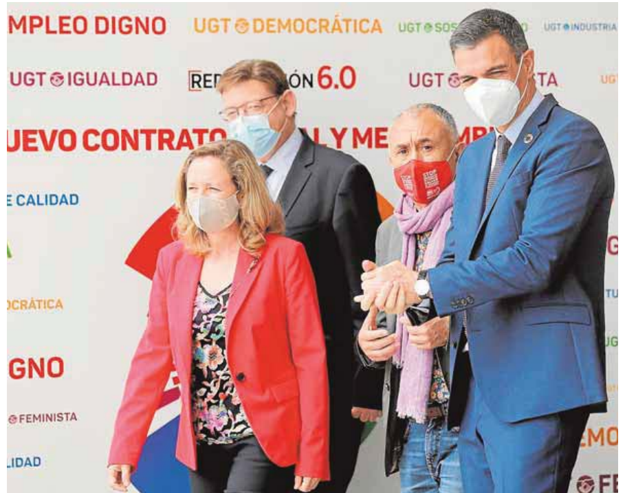
Pedro Sánchez, Nadia Calviño, Pepe Álvarez y Ximo Puig, ayer, en el Congreso de UGT en Valencia.

Otro claro mensaje que quiso mandar el Ejecutivo es que deroga antes de fin de año la reforma laboral. Yolanda Díaz lo volvió a hacer y esta vez en el Congreso y con la vicepresidenta segunda, Nadia Calviño, sentada a su derecha. Con rotundi-