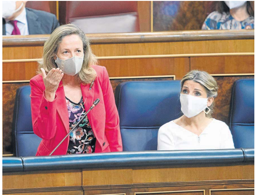
Yolanda Díaz escucha la intervención de Nadia Calviño en la sesión de control al Gobierno

de su fecha de caducidad) y la autorización administrativa en los ERE, "porque estamos viviendo una cascada de expedientes injustificada". También pidió a Díaz que derogue la prioridad aplicati-