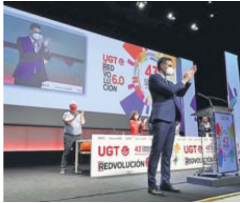
Sánchez, ayer, en el congreso de UGT en València.

Este plan concentra una «inversión de importantes dimensiones para hacer frente a uno de los grandes retos de nuestro mercado de trabajo», destacó. En concreto, las comunidades autónomas conta-