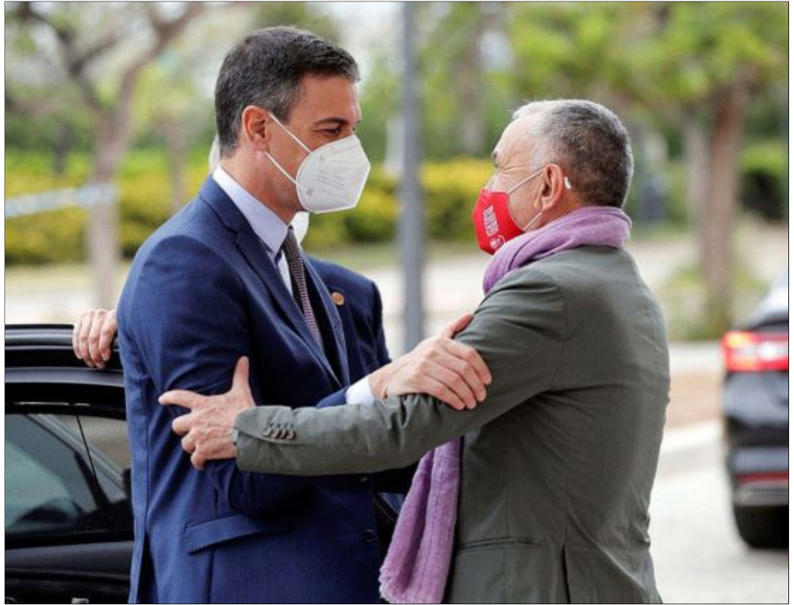
El presidente del Gobierno, Pedro Sánchez, saluda al secretario general de UGT, Pepe Álvarez, a su llegada al 43 Congreso Confederal de UGT, ayer.

Sánchez explicó a los afiliados de UGT que la puesta en marcha de un nuevo Estatuto de los Trabajadores es preferible a la derogación prometida por Díaz. El enfoque para reconducir el compromiso con los sindicatos es que, además de suprimir algunos artículos del marco aprobado por el PP, hay que «adaptarse a las nuevas