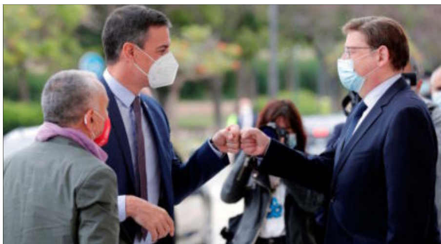
Pedro Sánchez y Ximo Puig se saludan, ayer, en Valencia antes del Congreso de la UGT.

Por su parte, Puig recordó que el ocio nocturno sigue cerrado