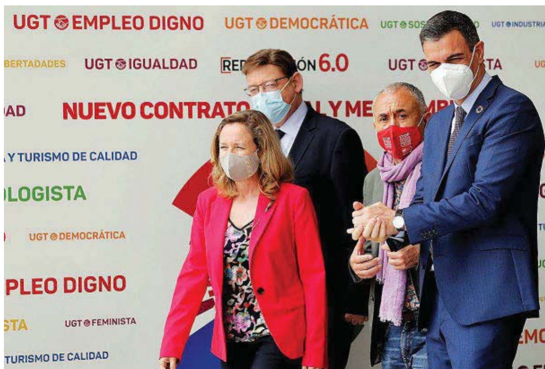
El líder socialista asistió a la cita sindical junto al secretario general de UGT, la ministra de Economía y el presidente de Valencia.