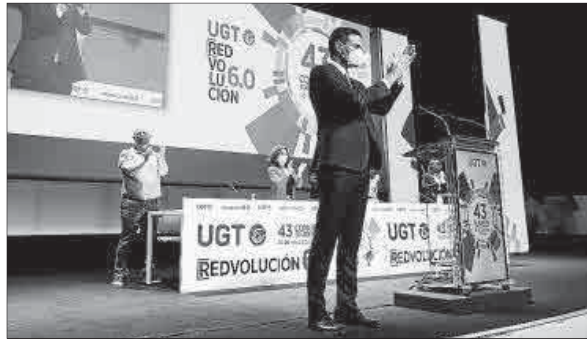
El presidente del Gobierno, en el Congreso Confederal de UGT.