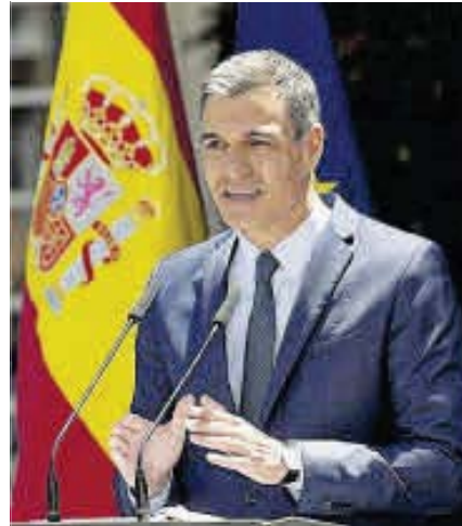
El presidente Pedro Sánchez.

El presidente del Gobierno, Pedro Sánchez, anunció ayer la “inminente” puesta en marcha de un plan de choque para hacer frente al desempleo juvenil dotado con 1.365 millones, que prevé formar y facilitar la contratación de más de un millón de jóvenes a lo largo de los próximos tres años. Sánchez hizo el anuncio durante su discurso en el 43 Congreso Confederal de UGT que se celebra en el Palacio de Congresos de Valencia, donde aseguró que “este Gobierno va a hacer todo lo posible para que los jóvenes tengan una oportunidad”. “Este plan concentra una inver-