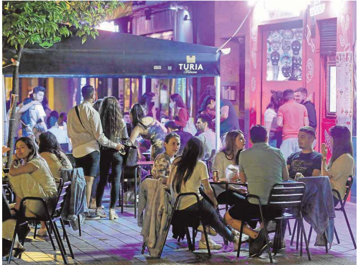
Jóvenes en una terraza antes de iniciarse el toque de queda.

El ocio nocturno, sin embargo, continuará vedado. Los locales de estos negocios sólo pueden funcionar actualmente como si