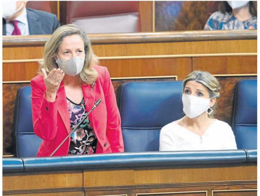
Yolana Díaz escucha la intervención de Nadia Calviño en la sesión de control al Gobierno

de su fecha de caducidad) y la autorización administrativa en los ERE, "porque estamos viviendo una cascada de expedientes injustificada". También pidió a Díaz que derogue la prioridad aplicati-