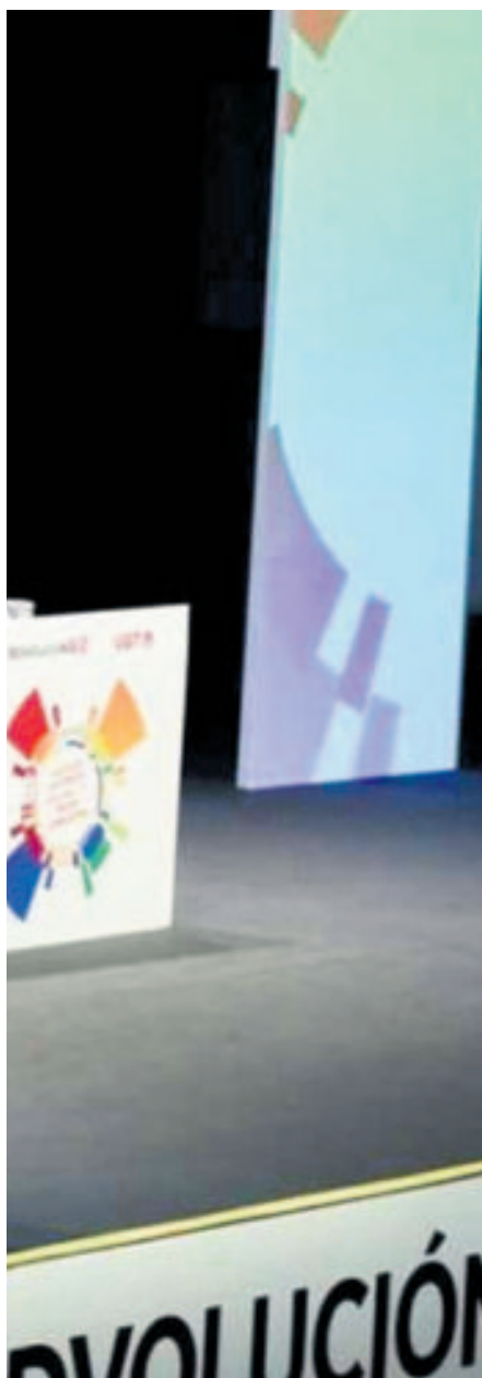
LA DEROGACIÓN DE LA REFORMA LABORAL. El Español

institucionalizar y reforzar la negociación colectiva”, respondió el presidente. “Tenemos que actualizar, como hemos hecho con la Ley rider o la del teletrabajo. La izquierda no solo tiene que decir que ‘vamos a desmantelar’, sino decir que ‘vamos a recuperar’”, expuso.