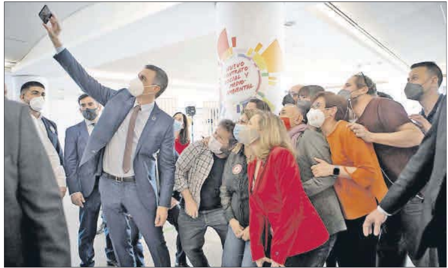
Sánchez hace una fotografía con la ministra Calviño y el líder de UGT, Pepe Álvarez, entre otros.

Pero por las palabras del presidente, parece evidente que no. Se limitó a hablar de «actualizar» la norma, como se ha hecho con la ley de riders o con la del teletrabajo y reclamó «no solo desmantelar sino también avanzar» en el reconocimiento y defensa de los derechos de los trabajadores ante los nuevos desafíos que presenta