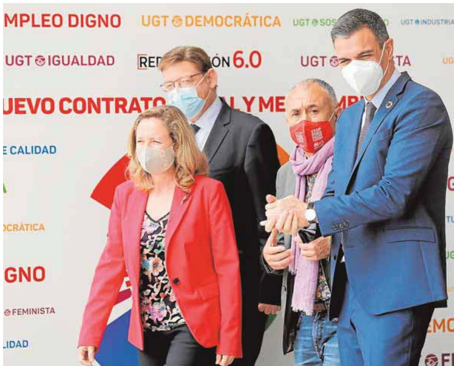
Pedro Sánchez, junto a Calviño, Pepe Álvarez y Ximo Puig, ayer, en el Congreso de UGT en Valencia.

Otro claro mensaje que quiso mandar el Ejecutivo es que derogará antes de fin de año la reforma laboral. Yolanda Díaz lo volvió a hacer y esta vez en el Congreso y con la vicepresidenta segunda, Nadia Calviño, sentada a su derecha. Con rotundi-