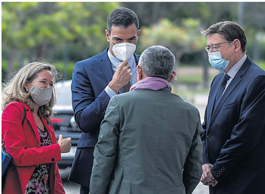
Nadia Calviño, Pedro Sánchez, Pepe Álvarez y Ximo Puig en Valencia.

En segundo lugar, el Programa Investigo para fomentar la investigación y la tecnología y retener talento que busca “posibilitar que esos talentos se queden y que nues-