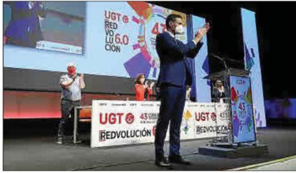
El presidente del Gobierno, en el Congreso Confederado de UGT.