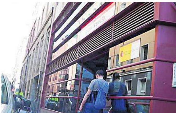
Prevé formar y facilitar la contratación de un millón de jóvenes en 3 años.