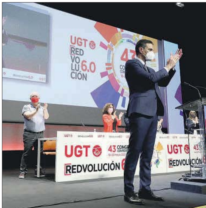
Pedro Sánchez ayer en Valencia.

La tasa de paro juvenil en España (que incluye a los menores de