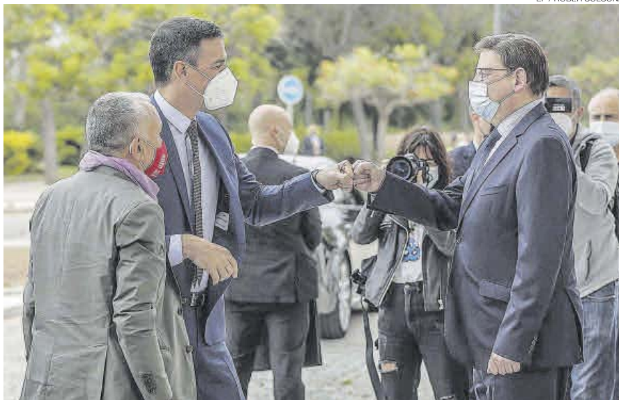
▶▶ El presidente del Gobierno, Pedro Sánchez, saluda al presidente de la Generalitat valenciana, Ximo Puig, ayer.