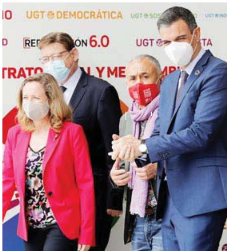
Calviño, Puig, Álvarez y Sanchez, ayer en el 43 congreso de UGT.

El presidente del Gobierno afirmó que esta salida de la crisis será más rápida que la de la anterior y señaló dos datos que indican ese camino en el empleo,