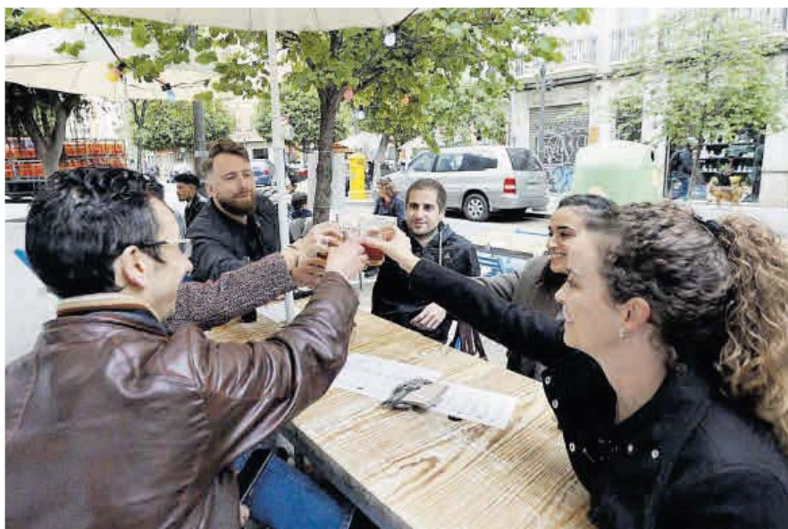
Los bares podrían cerrar pasada la medianoche si el Consell amplía los horarios.

La ampliación del toque de queda en la Comunitat Valenciana repercutirá también en el sector de la hostelería, ya que según adelantó Puig, «esto permitirá ampliar sus horarios». El Consell estudia elevar el horario del cierre de los bares hasta las 00.30 horas, si finalmente el cierre de la movilidad nocturna comienza a las 01.00 horas. Puig no quiso concretar horarios y dejó la decisión final para la comisión interdepartamental, a la espera tam-