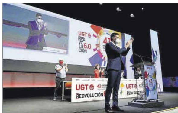
Pedro Sánchez en el Congreso Confederado de UGT.

nes lo que muchas veces se les niega: una primera oportunidad que les abra las puertas del mercado laboral", resaltó el presidente. En segundo lugar, el Programa Investigo, para fomentar la investigación y la tecnología y retener talento que busca "posibilitar que esos talentos se queden y que nuestro país aproveche sus valiosos conocimientos", ha apuntado. Y, en tercer lugar, el Proyecto Tándem, un plan que contempla un programa de formación que se desarrollará mientras el joven trabaja y que pretende fomentar el empleo en las ocupaciones de mayor futuro: transición ecológica