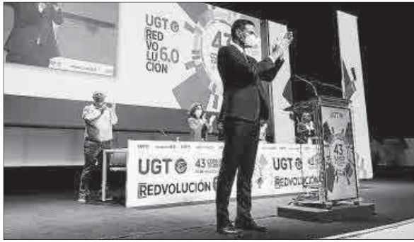
El presidente del Gobierno, en el Congreso Confederado de UGT.