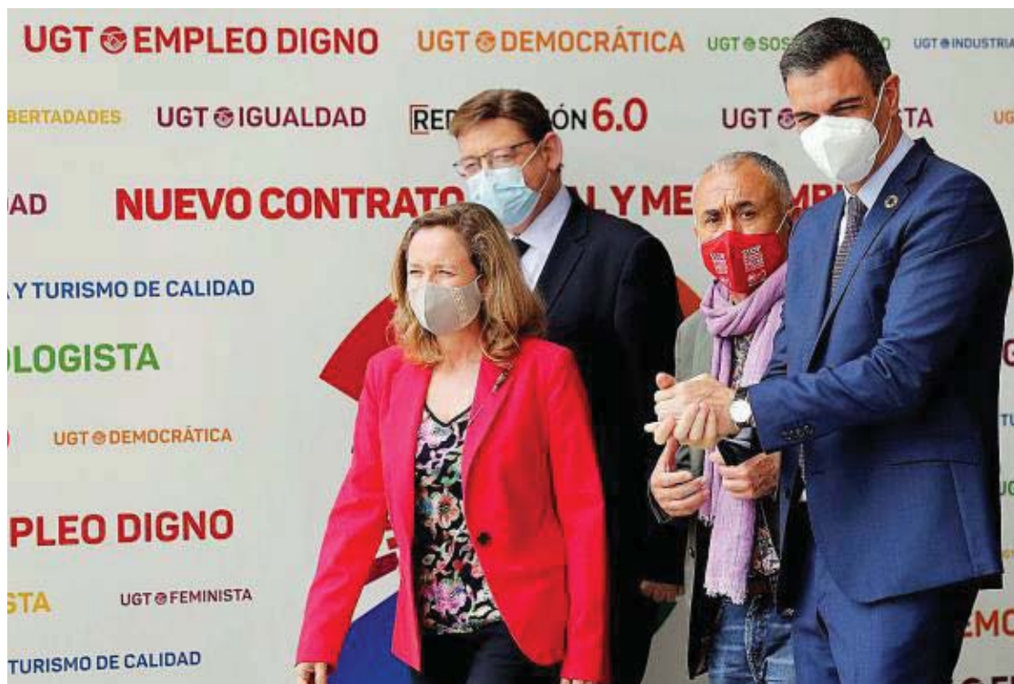
El líder socialista asistió a la cita sindical junto al secretario general de UGT, la ministra de Economía y el presidente de Valencia.