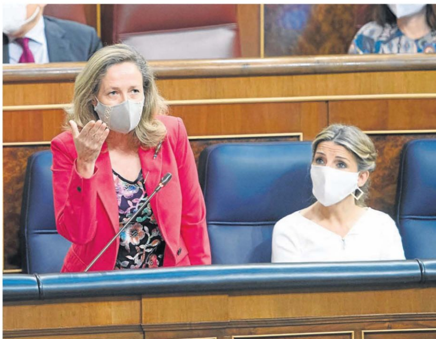
Yolana Díaz escucha la intervención de Nadia Calviño en la sesión de control al Gobierno

de su fecha de caducidad) y la autorización administrativa en los ERE, "porque estamos viviendo una cascada de expedientes injustificada". También pidió a Díaz que derogue la prioridad aplicati-