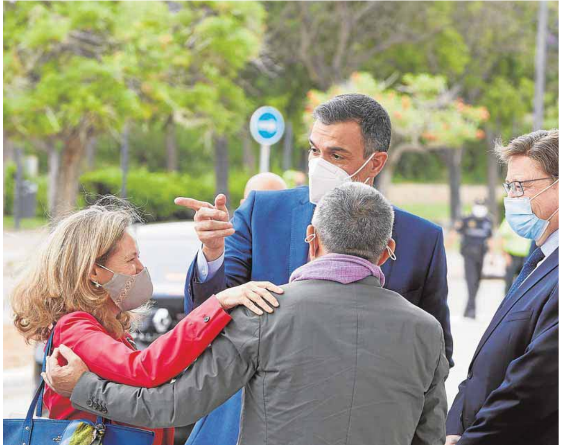
Nadia Calviño, Pedro Sánchez, Pepe Álvarez y Ximo Puig, en el congreso de UGT celebrado ayer en Valencia.

Sánchez prometió que con estas apuestas se podrá otorgar a los jóvenes un futuro con oportunidades y terminar con «la adolescencia perpetua» de uno de los colectivos más golpeados por la