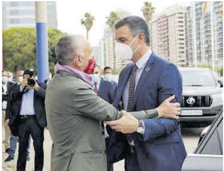
Pepe Álvarez saluda a Pedro Sánchez.

“Este plan concentra una inversión de importantes dimensiones para hacer frente a uno de los grandes retos de nuestro mercado de trabajo”, destacó. En concreto, las comunidades autónomas contarán con 600 millones para financiar contratos formativos que otorguen oportunidades de empleo y formación para jóvenes menores de 30 años. Asimismo, se invertirán otros 765 millones en tres programas dedicados al empleo joven. En primer lugar, el “Programa Primeras Experiencias Profesionales”. Con él, “vamos a dar a nuestros jóvenes lo que muchas veces se les niega: una primera oportunidad que les abra las puertas del mercado laboral”, resaltó el presidente. En segundo lugar, el