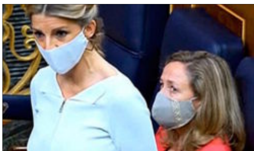
Nadia Calviño suspira y gesticula levemente ante las palabras de Díaz, ayer.

El presidente indicó que la puesta en marcha de sus planes es inminente, llamando a los afiliados de UGT reunidos en Valencia a mantener unida la izquierda. «Si fuera afiliado contarías con mi voto», le ha dicho al secretario general de UGT, Pepe Álvarez, que reeditará en es-