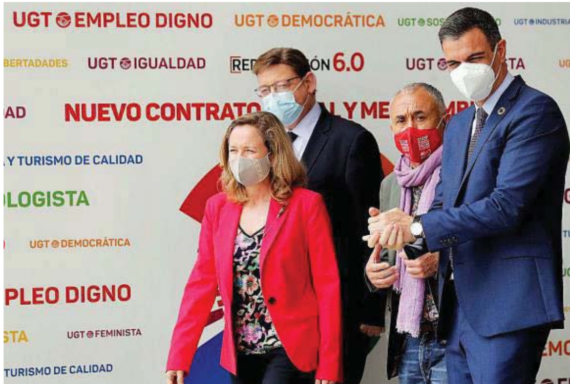
El líder socialista asistió a la cita sindical junto al secretario general de UGT, la ministra de Economía y el presidente de Valencia.